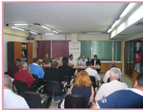
Εικόνα: Από τη Γενική Συνέλευση της εταιρείας της 30ης Ιουνίου 2010