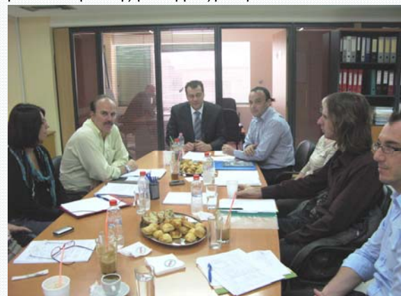
Φωτογραφία: Από την διαβούλευση που πραγματοποιήθηκε στα γραφεία της ΑΝΕΣΕΡ ΑΕ στις 12/10/2009 με συμμετοχή της πολιτικής ηγεσίας και υπηρεσιακών παραγόντων των δύο πλευρών.

Στόχος του δεύτερου έργου είναι η αξιοποίηση του φυσικού πόρου της γεωθερμίας με την όσο το δυνατόν