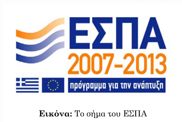
Εικόνα: Το σήμα του ΕΣΠΑ

Δεύτερης Ευκαιρίας, των Κέντρων Εκπαίδευσης Ενηλίκων και του Ανοικτού Πανεπιστημίου και ενίσχυση των Ινστιτούτων Δια Βίου Εκπαίδευσης, επιμόρφωση των εκπαιδευτικών και ενισχυμένη διδασκαλία των μειονοτήτων. Πληροφορίες για το Ε.Π. από την παρακάτω ηλεκτρονική διεύθυνση: http://www.epeaek.gr/epeaek/jsp/el/a_6_1.jsp