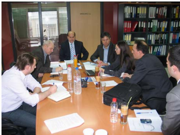
Φωτο: Από τη συνάντηση εργασίας των δύο αντιπροσωπειών στα γραφεία της ANESER

Το πρόγραμμα αυτό έχει ως στόχο τη βελτίωση των ικανοτήτων των τοπικών (Σερβικών) αρχών, την αναβάθμιση των παρεχόμενων απ' αυτές υπηρεσιών και την τόνωση