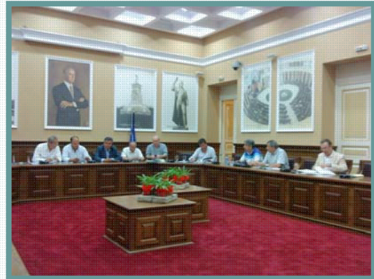
Αίθουσα Κωνσταντίνος Καραμανλής. Γενική Συνέλευση Μετόχων.

Κατά τη διάρκεια της Γενικής Συνέλευσης έγινε γνωστή η πρόθεση κάποιων μελών του Διοικητικού Συμβουλίου να παραιτηθούν προκειμένου να αντικατασταθούν από εκπροσώπους των νέων φορέων που προέκυψαν κυρίως λόγω του Καλλικράτη. Για το λόγο αυτό η Γενική Συνέλευση αποφάσισε τη σύγκληση έκτακτης Γενικής Συνέλευσης προσδιορίζοντας την ημερομηνία για την 22α Ιουλίου 2011 με μοναδικό θέμα την εκλογή νέου Διοικητικού Συμβουλίου της εταιρείας.