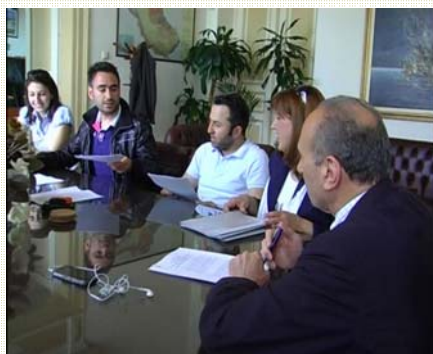
Εικόνα 22: Copyright Δίκτυο Τηλεόραση

Από μέρα σε μέρα αναμένεται η σχετική έγκριση ώστε η προκήρυξη να δημοσιευτεί στον τοπικό τύπο και να ξεκινήσει η προθεσμία για την υποβολή επενδυτικών σχεδίων. Από τις συναντήσεις που πραγματοποιούνται καθημερινά στα γραφεία της ΑΝ.Ε.ΣΕΡ. με υποψήφιους επενδυτές, φαίνεται κατ' αρχήν ότι σε αυτή την πρόσκληση, παρά τη δύσκολη οικονομική συγκυρία, θα υπάρχει σημαντικό επενδυτικό ενδιαφέρον σε νέους κλάδους της οικονομίας.