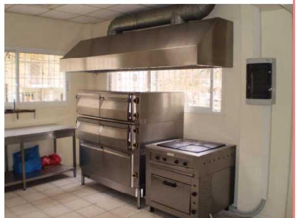
Εικόνα 3: Οι εγκαταστάσεις του κοινωνικού συσιτίου