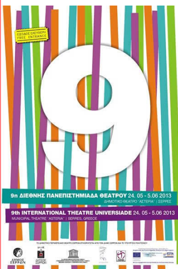
Εικόνα 2: Το λογότυπο της 9ης Πανεπιστημιάδας

Με τη συμμετοχή της η ANEΣΕΡ ως ανάδοχος του έργου «Παροχή υπηρεσιών υποστήριξης για τη διοργάνωση της Πανεπιστημιάδας Θεάτρου στο Δήμο Σερρών έτους 2013» έδειξε ότι αντιμετωπίζει το θεσμό όχι μόνο ως μια πηγή πόρων, αλλά ως ένα σημαντικό πολιτιστικό γεγονός για την πόλη που συνδέεται άμεσα με την ίδια την οικονομία της. Δεν είναι επομένως τυχαίο ότι κάλυψε με ίδιους πόρους τμήματα του διαγωνισμού για τα οποία δεν υπήρξε ανάδοχος όπως ήταν το τμήμα των μεταφράσεων και της διερμηνείας καθώς και μέρος του διαφημιστικού υλικού.