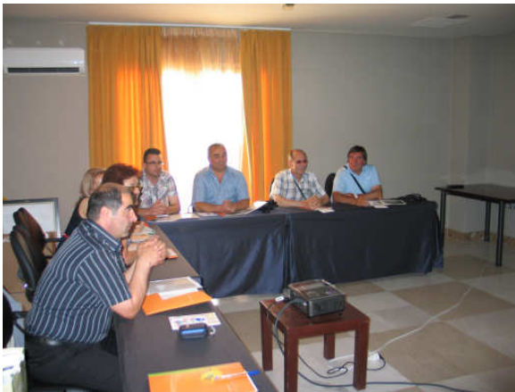
Εικόνα 8: Από τη συνάντηση εργασίας

Το τριήμερο 29 έως 31/5/2013 η ΑΝ.Ε.ΣΕΡ. φιλοξένησε 7 στελέχη από τη Βουλγάρικη