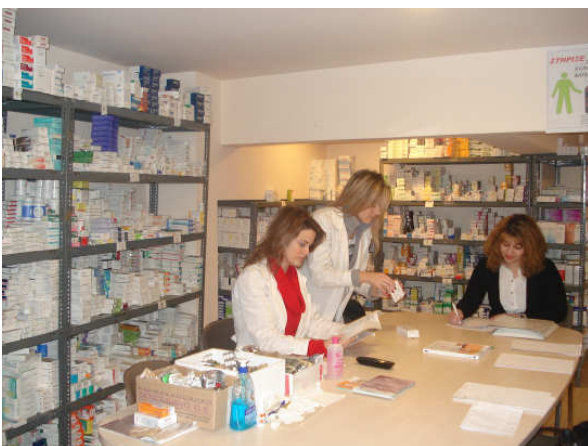
Εικόνα 4: Αποψη του κοινωνικού φαρμακείου

Με τη δομή αυτή παρέχονται δωρεάν φάρμακα, υγειονομικό υλικό και παραφαρμακευτικά προϊόντα σε τουλάχιστον 100 άστεγους, άπορους και άνεργους κάθε μήνα. Για τη λειτουργία του κοινωνικού φαρμακείου ακολουθείται συγκεκριμένη πολιτική με την εξασφάλιση συνεργασιών με τον τοπικό φαρμακευτικό σύλλογο και τους φαρμακοποιούς του νομού καθώς και με την προσφορά από πολίτες και συλλογικούς φορείς. Οι διαδικασίες της προμήθειας και της έγκαιρης παραλαβής των προϊόντων που διατίθενται από το κοινωνικό φαρμακείο πραγματοποιείται με μέριμνα και ευθύνη των εργαζομένων στο Κοινωνικό Φαρμακείο και