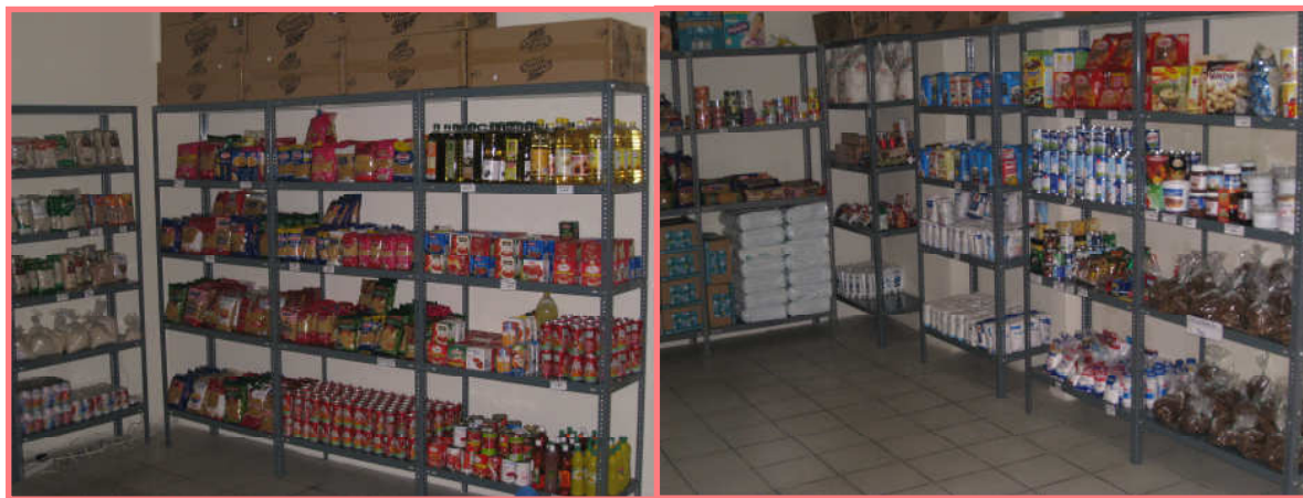
Εικόνα 5: Κοινωνικό Παντοπωλείο

Στο πλαίσιο λειτουργίας του Κοινωνικού Παντοπωλείου διανέμονται δωρεάν, σε τακτική βάση, σε ωφελούμενα άτομα που το έχουν ανάγκη, τρόφιμα, είδη παντοπωλείου, είδη ατομικής υγιεινής, κλπ.