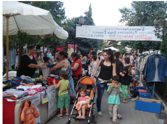
Εικόνα 6: Από το 1ο Ανταλλακτικό Παζάρι

Την Πέμπτη 21 Ιουνίου διεξήχθη με μεγάλη επιτυχία το 1ο Ανταλλακτικό Παζάρι στην Πλατεία Ελευθερίας (Μπεζεστένι). Οι Σερραίοι δημότες αγκάλισαν με ενθουσιασμό το πρώτο αυτό εγχείρημα πραγματοποιώντας 680 ανταλλαγές προϊόντων. Εντυπωσιακή ήταν η ποικιλία των προϊόντων όπως βιβλία, ρούχα, παπούτσια, μικροσυσκευές, παιχνίδια, διάφορα αξεσουάρ, φωτιστικά, cd, dvd και πολλά άλλα αποδεικνύοντας έμπρακτα την διάθεση προσφοράς. Αξίζει να αναφέρουμε ότι πολλοί συμπολίτες μας ενδιαφέρονταν να προσφέρουν χωρίς να τους απασχολεί η αντικειμενική αξία του προϊόντος που θα λάμβαναν. Το ενδιαφέρον όλων εστιάστηκε στην πεμπουσία της ανταλλαγής με γνώμονα τον επαναπροσδιορισμό της αξίας των αντικειμένων.