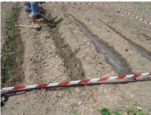
Εικόνα 7: Δημοτικός λαχανόκηπος. Το φύτεμα ξεκίνησε.

Για τη λειτουργία του δημοτικού λαχανόκηπου, έχει διατεθεί συγκεκριμένη γεωργική έκταση αρδευόμενη και περιφραγμένη καθώς και ο απαραίτητος εξοπλισμός για την καλλιέργειά του. Οι ωφελούμενοι καλλιεργούν συγκεκριμένη έκταση 50 τμ περίπου με οπωροκηπευτικά με σκοπό τη σίτιση τους για ένα έτος.